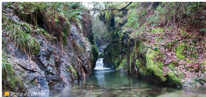
Pozo do Demo

El río Xabriña, afluente del Tea, se convierte en el verdadero protagonista de esta ruta circular que parte de la parroquia de Paraños y que visita otros lugares como Prado de Canda y A Lamosa.